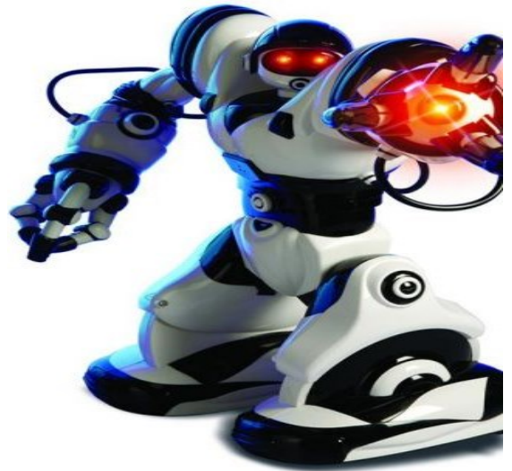
Пояснительная подпись под рисунком.

Робототехника (от робот и техника ; англ. robotics — роботика [1] , роботехника [2] ) — прикладная наука , занимающаяся разработкой автоматизи-